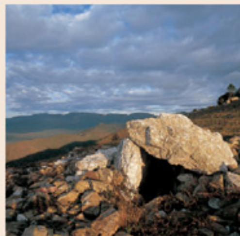
Dolmen de Puig d'Esquers I

aniríem a l'ermita de Sant Miquel de Colera, el nostre itinerari continua per l'esquerra. Anem pujant per la pista fins al puig d'Esquers (3 h 31 min) . Continuem la carena en direcció sud i trobarem el dolmen de Puig d'Esquers I. Baixem carena avall fins a trobar un coll, anirem a la dreta per creuar la pista, i agafem el corriol que en portarà a l'església de Sant Martí de Vallmala (4 h 06 min) . Darrera l'església agafem un corriol, a la nostra esquerra queda una barraca de pedra i poc més enllà trobem a la dreta la font d'en Perassa (4 h 10 min) . D'aquí surt un corriol que travessa un rec i poc després ens trobem un altre a la dreta que puja al dolmen del Passatge. Reculem per trobar el corriol que hem deixat i el continuem a la dreta. Arribem al coll del Trauc (4 h 55 min) i agafem un corriol que surt a l'esquerra. Trobem una cruïlla i prenem el corriol de la dreta que ens porta a una pista. Seguint a la dreta tornarem a Vilamaniscle (5 h 45 min) .