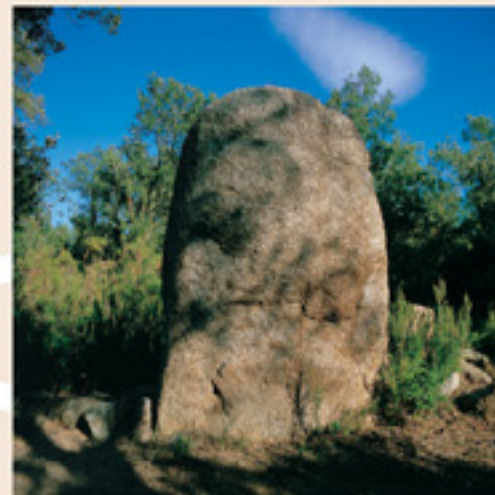
Menhir dels Estanys I