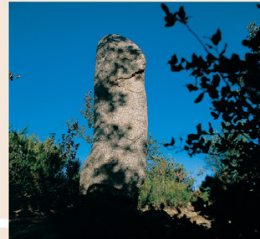
Menhir dels Estanys II